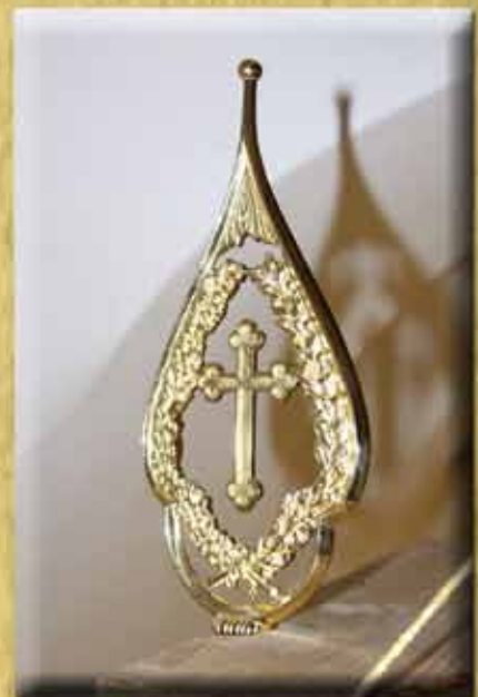
Messingspitze zaponiert und hochglanzpoliert