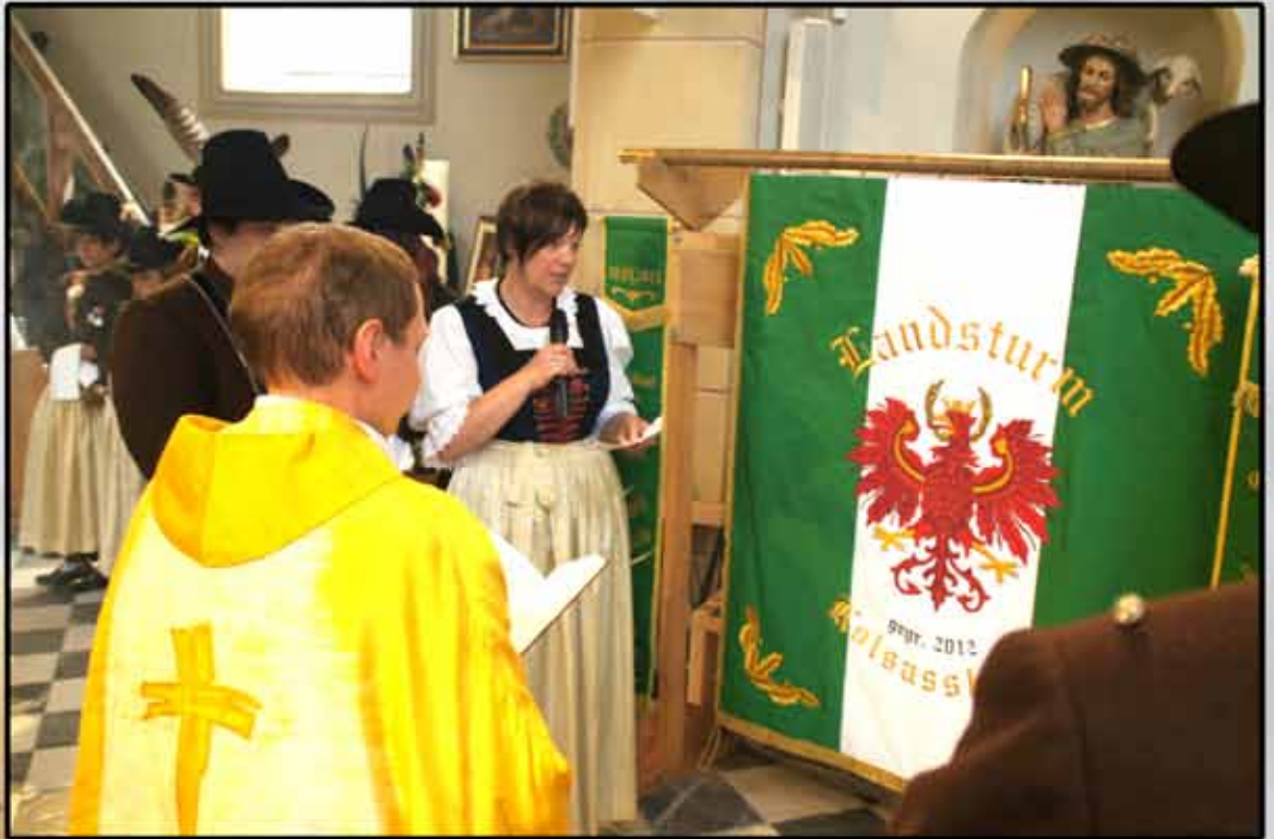
Übergabe der Fahnenbänder durch die Patin