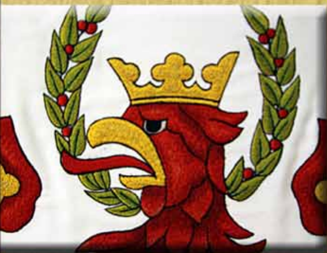
Plattenstichstickerei mit Schattierungseffekt mit Baumwollgarne