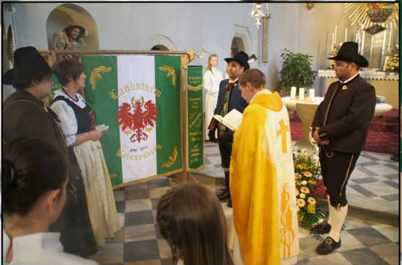
Messe mit Segnung