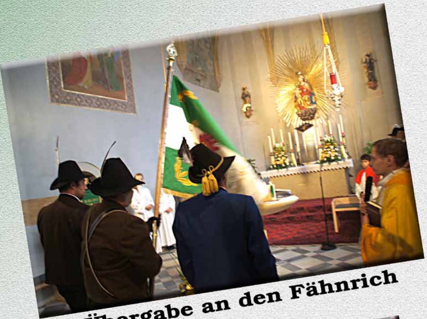
Übergabe an den Fähnrich