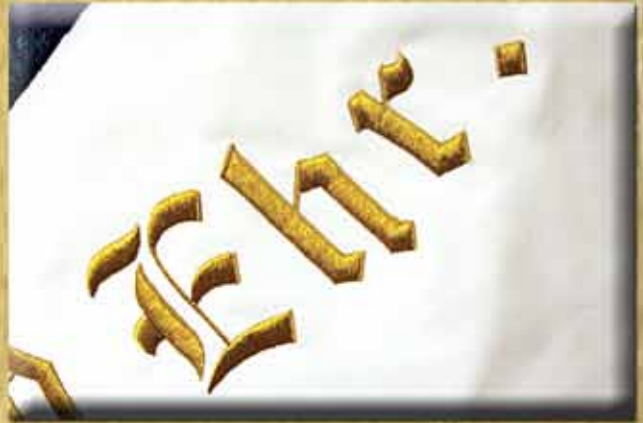
Goldlurex in Plattstich