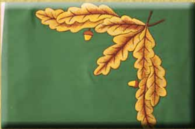
Plattenstich mit Schattierungseffekt mit Gold,- Bronze.- Lurexfäden