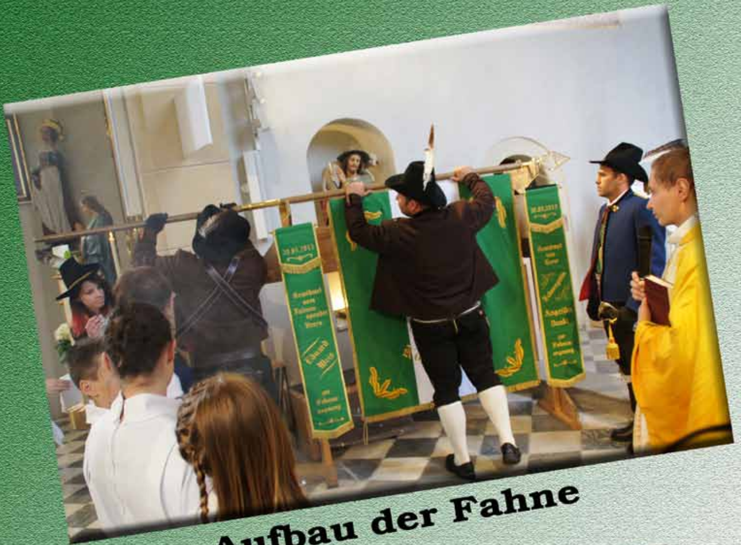
Aufbau der Fahne